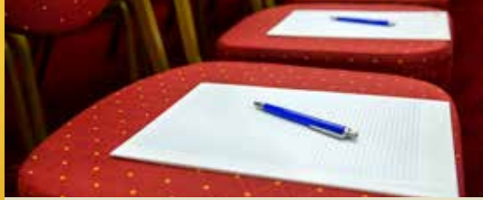
Het Zwevegense meerjarenplan doorgelicht (p. 2)