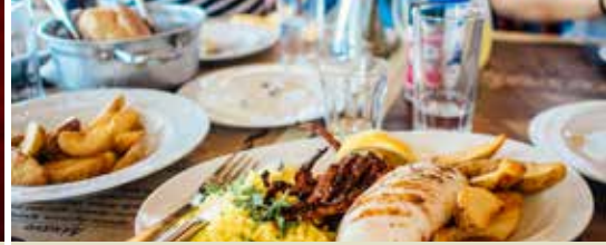
Jaarlijks eetfestijn op 25 oktober met Koen Daniëls (p.3)