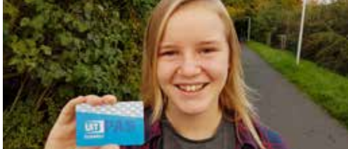
Iedereen heeft recht op vrije tijd p.2