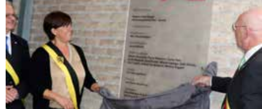
Nieuwe vleugel WZC geopend p.3