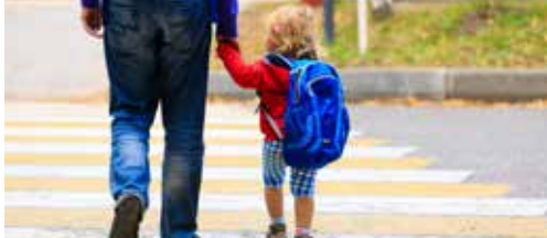
Veilig naar de Kouterschool p. 2