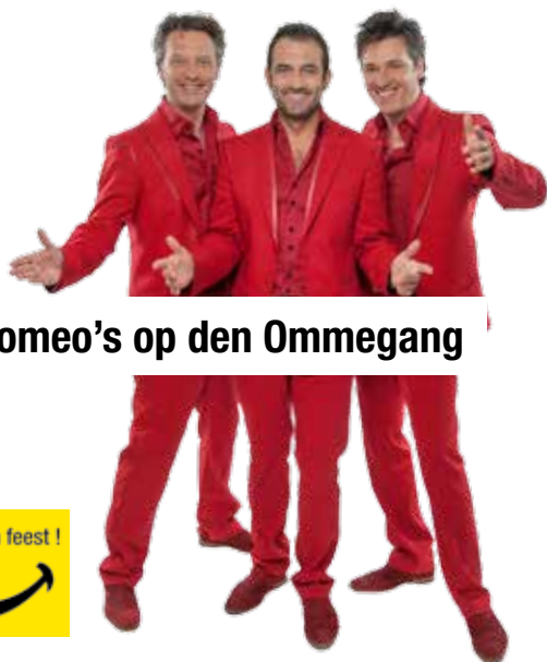
De Romeo's op den Ommegang

Dit jaar valt het weekend van Zwevegem Ommegang gelijk met de start van de zomervakantie. We openen dan ook met een knaller. Niemand minder dan de Romeo's trappen de festiviteiten op gang, en ze komen niet alleen!