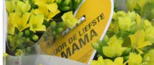
N-VA Zwevegem viert moeder p. 3